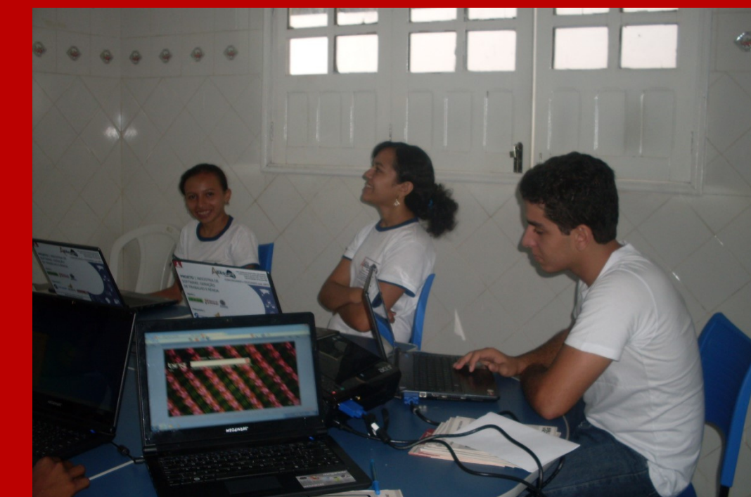
Jovens do Bairro Tiradentes aprendem técnicas de Linguagem de Programação