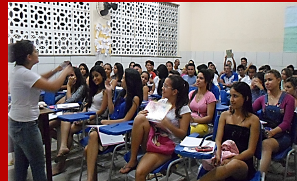
Prevest-Popular - uma parceria com a prefeitura de Acaraú e secretaria de Educação.