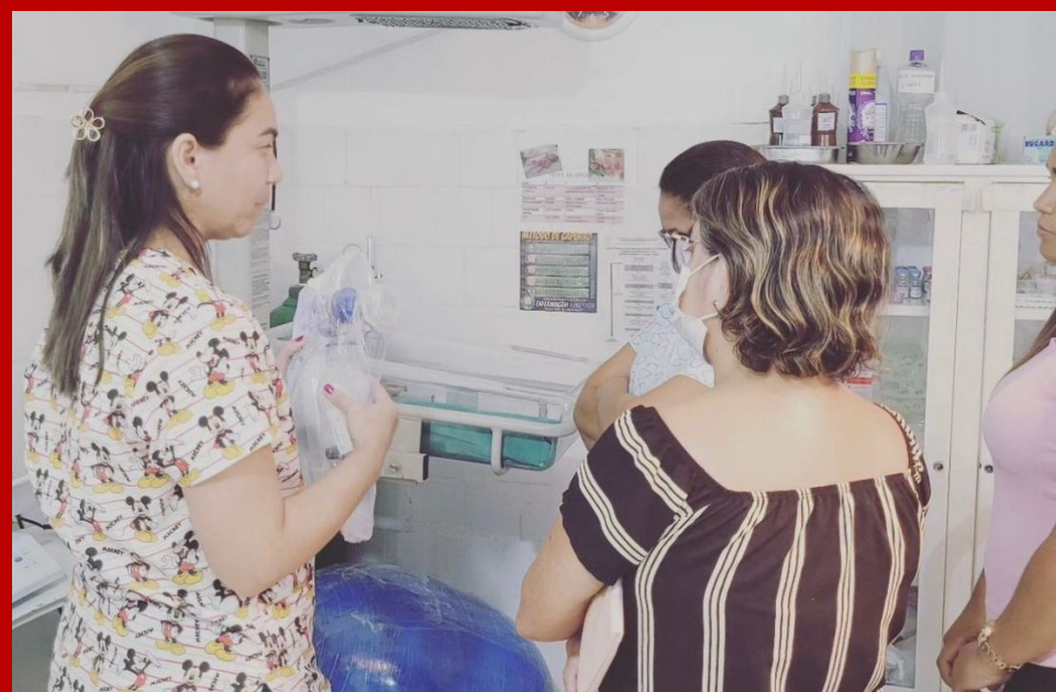
Maternidade do Hospital N. S. dos Milagres realiza capacitação sobre pré-parto, parto e puerpério.

Conhecimento é Liberdade com Responsabilidade