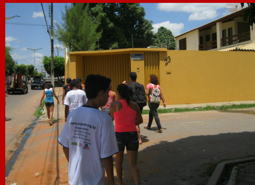
Instituto Anandua realiza curso de fotografia para adolescentes em Juazeiro do Norte